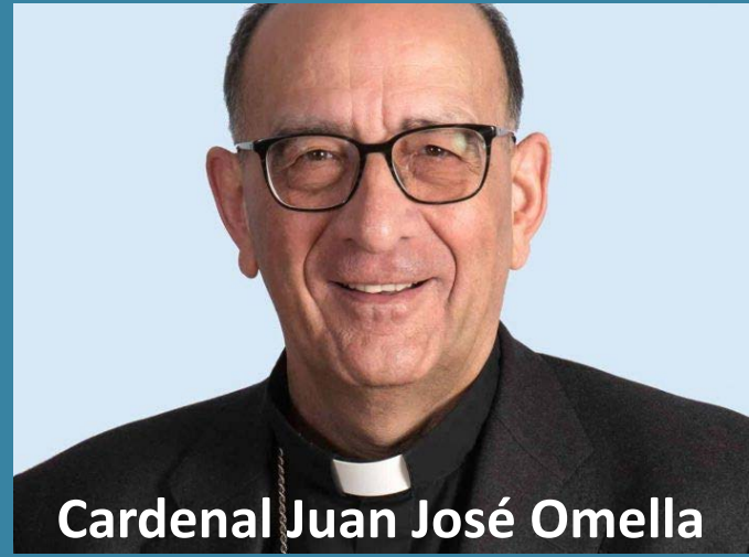
Cardenal Juan José Omella