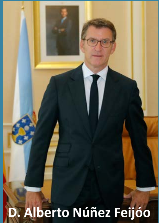
D. Alberto Núñez Feijóo